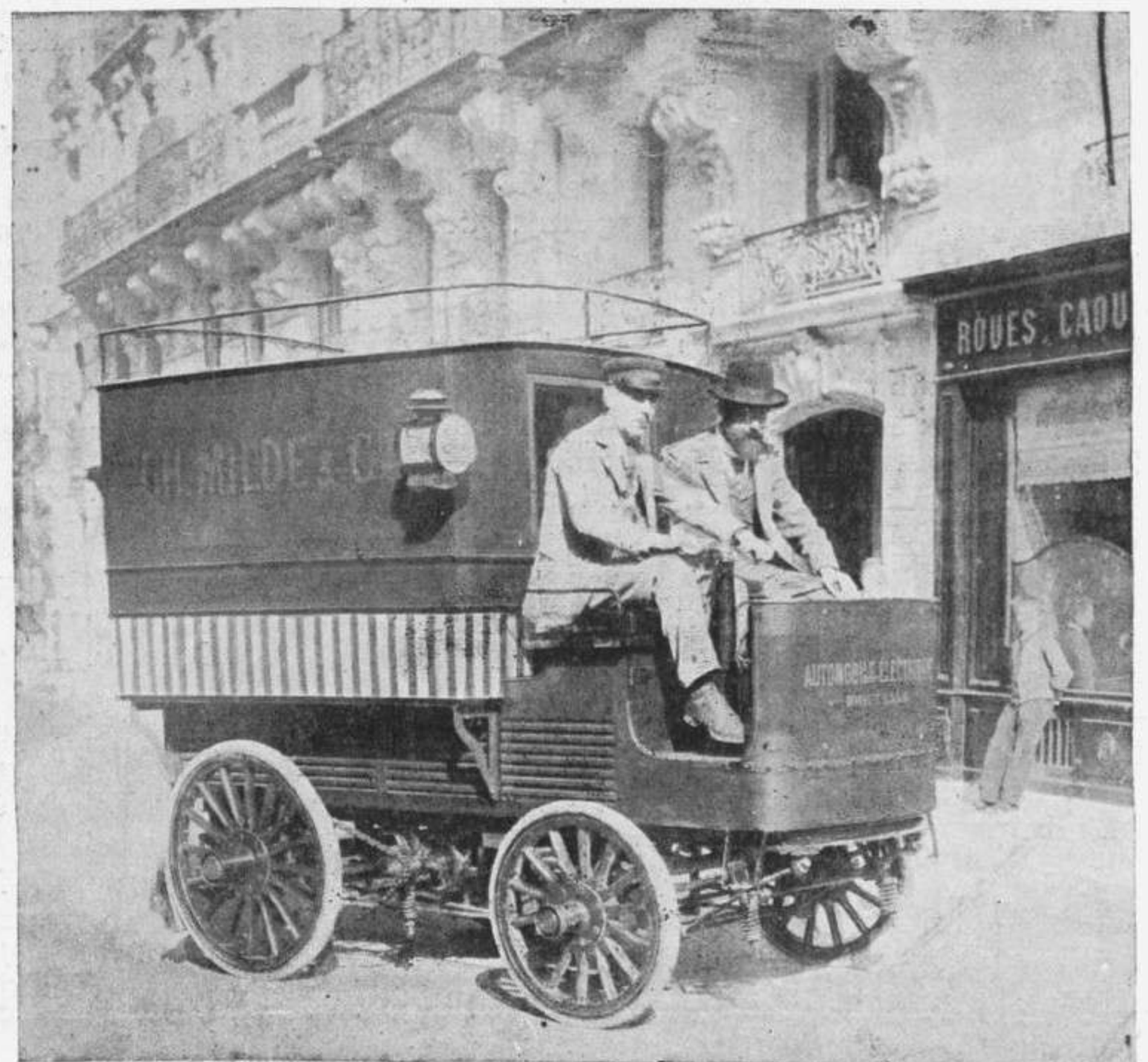
VOITURE DE LIVRAISON MILDÉ ET C ie