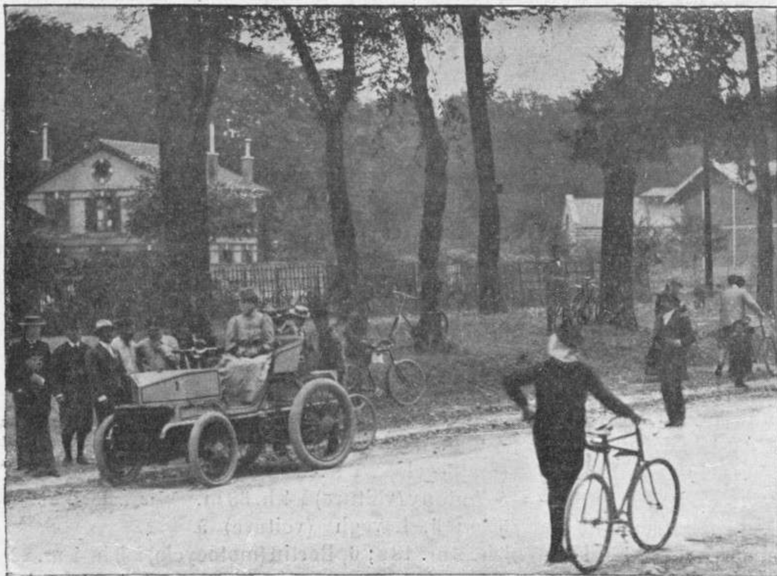
La voiture de M. Lemaitre, le long de la route des Loges, à St-Germain, avant le départ. M. Lemaitre est arrivé 3 e à Ostende, couvrant les 322 kil. du parcours en 6 h. 32 m.